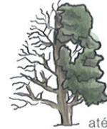
até 30 m