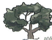
até 10 m