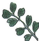
composta, achatada na ponta com sulco

Utilizações: Fruto comestível de grande valor alimentar (muito importante em alimentos destinados a diabéticos); também utilizado em rações para o gado.