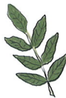
composta, forma oval