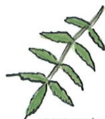
composta, forma de lança serrada