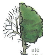
até 10 m