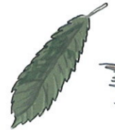
forma de lança, serrada