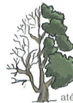
até 25-50 m