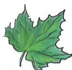
forma de palma, fendida