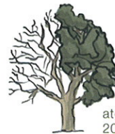
até 20-30 m