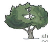
até 20 m