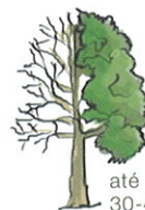
até 30-40 m