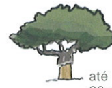
até 20 m