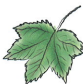
forma de palma, serrada

Utilizações: Madeira para mobiliário, marcenaria e instrumentos musicais. Ornamental.