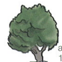
até 10 m