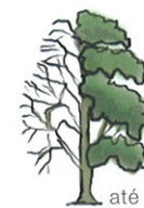
até 25-30 m